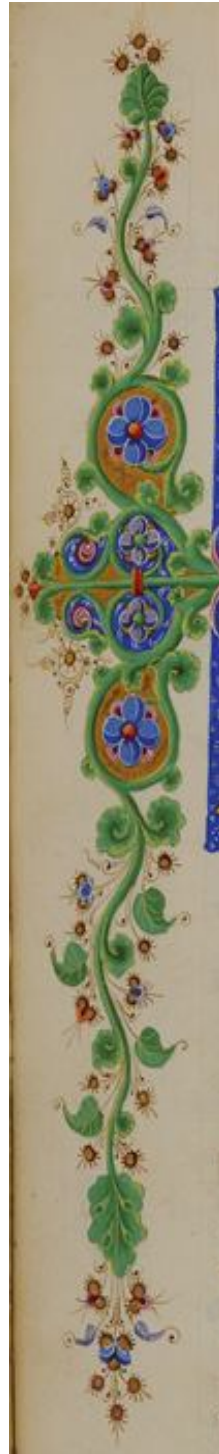
Dettaglio 'DIX1, pag. 154'