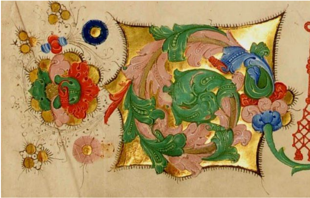
Dettaglio 'Crivelli DIII3'